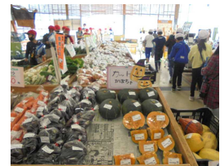
B 郷土や地域の良さへの実感