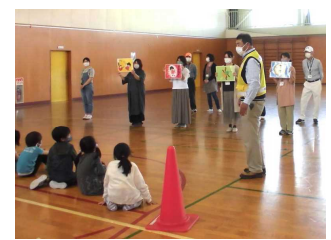
D サポート体制の充実