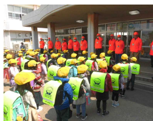
C 安心安全な体制づくり