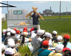
A 様々な人とのかかわり